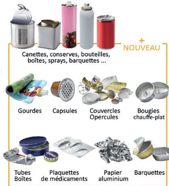
Canettes, conserves, bouteilles, boîtes, sprays, barquettes ...