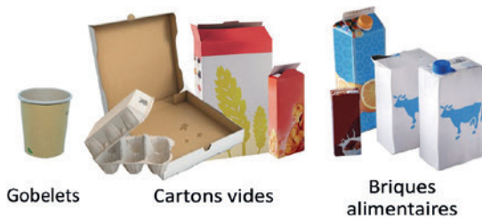
Gobelets Cartons vides Briques alimentaires

C'est un emballage, ou un papier ? Je le trie !