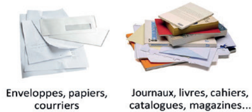
Enveloppes, papiers, courriers Journaux, livres, cahiers, catalogues, magazines...

Emballages en carton et briques alimentaires