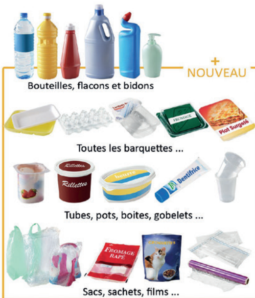
Bouteilles, flacons et bidons