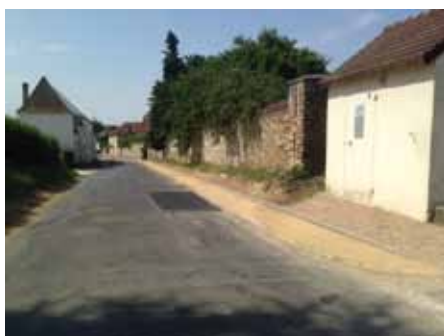
Trottoir entre la sente de la Mare neuve et le lavoir