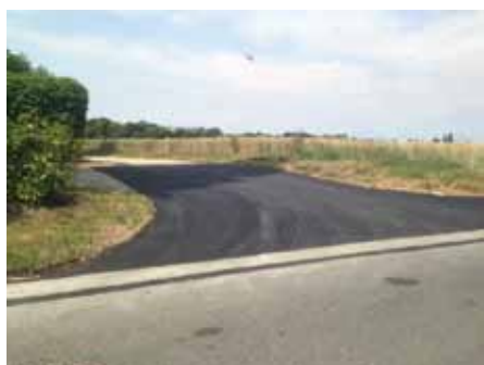
Chemin de Montfort