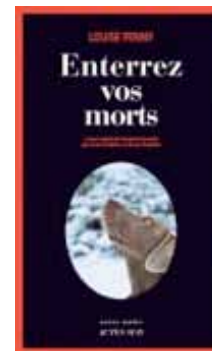
« Enterrez vos morts » Louise PENNY