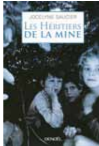
« Les héritiers de la mine » Jocelyne SAUCIER