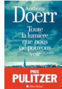
« Toute la lumière que nous ne pouvons voir » Anthony DOERR