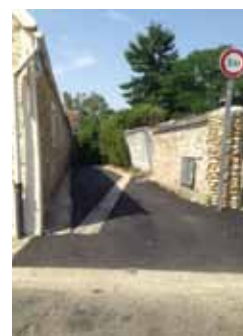
Sentier du Val Cornu