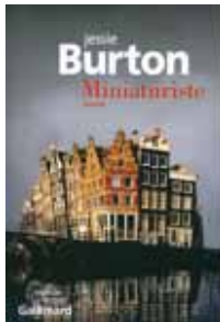
« Miniaturiste » Jessie BURTON

Les bibliothécaires ont choisi pour cet été quelques titres à découvrir :