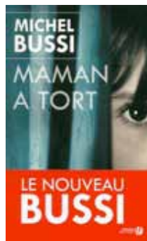
« Maman a tort » Michel BUSSI