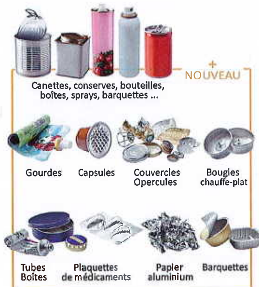
Canettes, conserves, bouteilles, boîtes, sprays, barquettes ...