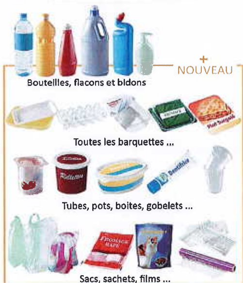
Bouteilles, flacons et bidons